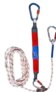
En option: Longe réglable et absorbeur d'énergie