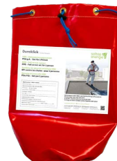
Harnais de sécurité