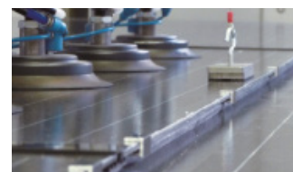
Belastungstest Photovoltaik Module