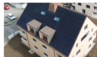
Mehrfamilienhaus / öffentliche Bauten